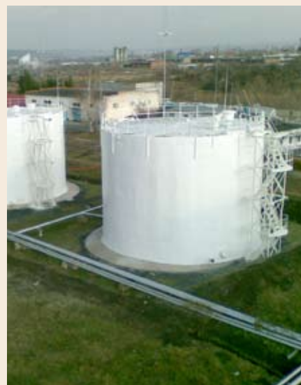
Рис. 1. РВС-1000 г. Альметьевск

Насосные линии и опорные конструкции терминалов и хранилищ обычно расположены вне помещений. Таким образом они подвергаются постоянному климатическому воздействию, перепадам температур и УФ-излучению. Внешнее покрытие на основе полиуретанов обеспечивает отличную прочность и атмосферную устойчивость.