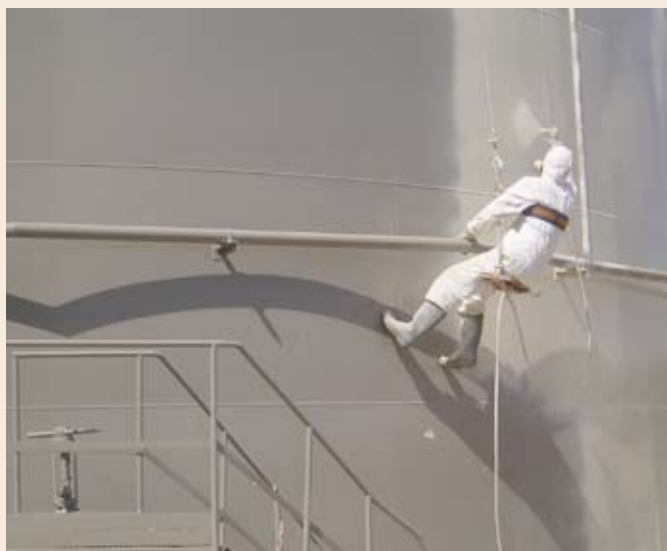
Рис. 2. Нанесение краски Temathane 90 на внешнюю поверхность PBC-2000, г. Домодедово

Итоги работы ЗАО НТК «Аэрокосмос» в течение последних 10 лет по антикоррозионной защите технологического оборудования и резервуаров на предприятиях авиационной и нефтеперерабатывающей отраслей позволяют оценить общее состояние защитных покрытий существующих сооружений и оборудования для переработки и хра-